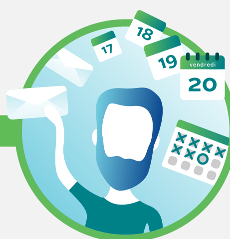
Lettre de confirmation