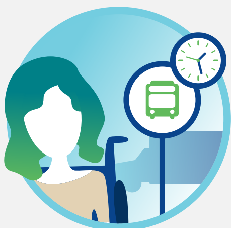
Livraison du service

Pour toute information il est possible de contacter le centre d'appel au 819-773-2222 ou de consulter le www.sto.ca