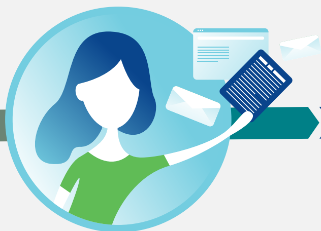
Demande d'admission au transport adapté