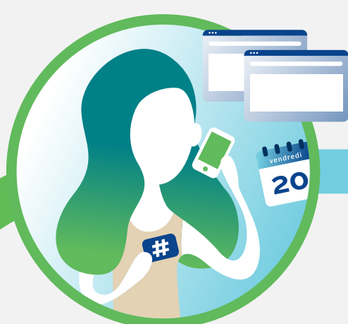
Demande de déplacement