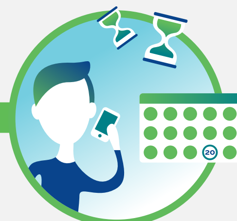
Confirmation du déplacement